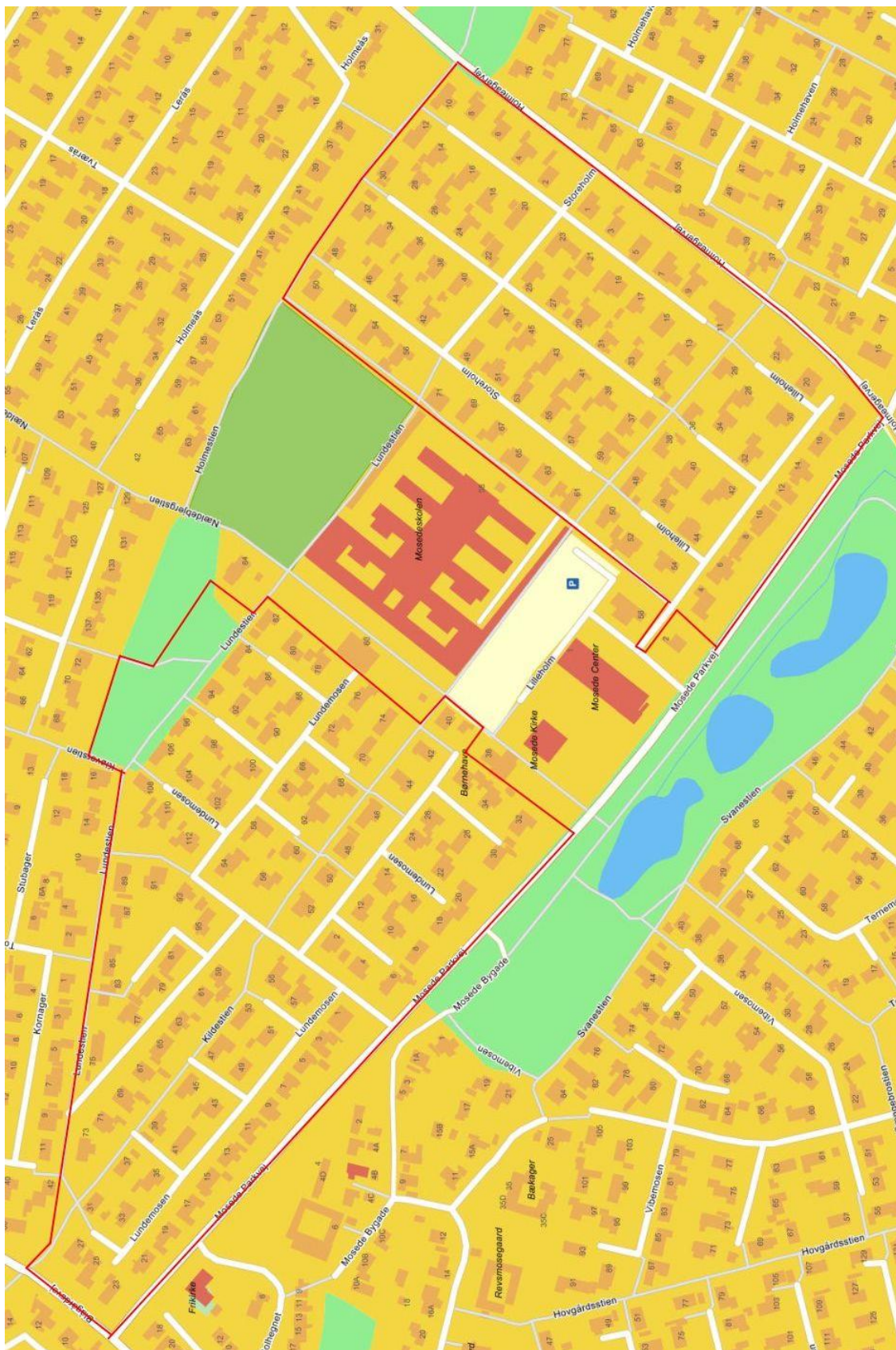
Helhedsplan for vedligeholdelse af grundejerforeningens arealer