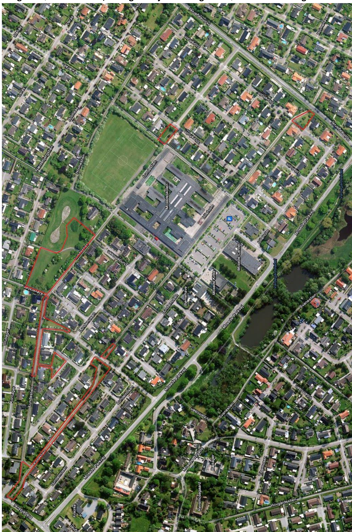
Helhedsplan for vedligeholdelse af grundejerforeningens arealer